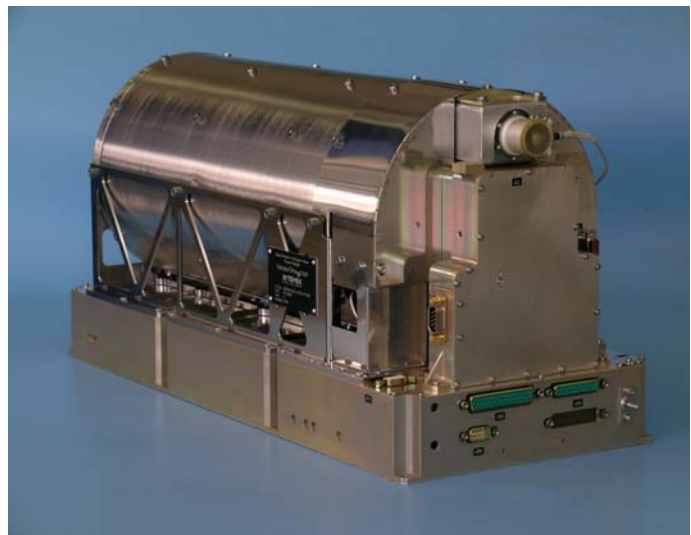
Wasserstoffuhr (Passive Hydrogen Maser)

lieferte mit den drei Atomuhren die eigentlichen Kernelemente von GIOVE-B. In der Satellitennavigation sind präzise Uhren von zentraler Bedeutung, ist doch die Genauigkeit des ausgesendeten Zeitsignals ausschlaggebend für die Genauigkeit der Positionsbestimmung. Neben zwei Rubidium-Uhren ('Rubidium Atomic Frequency Standard' RAFS) wie sie bereits an Bord von GIOVE-A mitgeführt werden, verfügt GIOVE-B als Weltpremiere zusätzlich über eine Wasserstoffuhr ('Passive Hydrogen