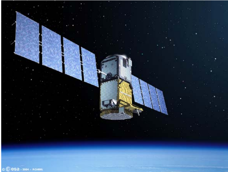
GIOVE-B (künstlerische Darstellung)

Die wichtigsten Aufgaben von GIOVE-B umfassen neben der Sicherung der von der 'International Telecommunication Union' (ITU) für Galileo reservierten Frequenzen auch die Messung der Strahlungsverhältnisse entlang der Umlaufbahn und das Testen von neuen Technologien.