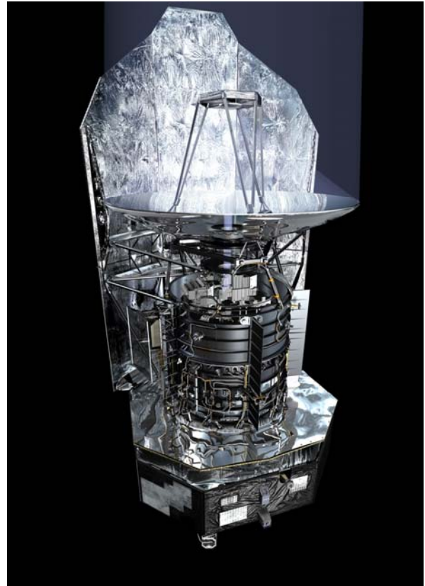
Eine computergenerierte Schnitt-Darstellung des Satelliten Herschel mit Blick in den Kryostaten und auf die wissenschaftlichen Instrumente. Im Hintergrund ist der Sonnenschutzschild zu sehen.

Die ESA hatte bereits Mitte der 1990er Jahre den Infrarotsatelliten ISO (Infrared Space Observatory) in eine Erdumlaufbahn gebracht. Teleskop und Instrumente befanden sich bei diesem Satelliten innerhalb einer sehr grossen, mit flüssigem Helium gefüllten „Thermosflasche“ (Kryostat) bei einer Temperatur von einigen Kelvin (ca. -270\text{ °C} ). Solch tiefe Temperaturen sind notwendig, um bei Beobachtungen im Infrarotbereich die thermische Abstrahlung des Satelliten möglichst gering zu halten. Bei Herschel musste der Spiegel aufgrund seines Durchmessers von 3.5 m ausserhalb des Kryostaten angebracht werden. Um trotzdem die notwendigen tiefen Temperaturen zu erreichen, wird der Satellit weit weg von der Erde in einer speziellen Umlaufbahn um die Sonne, dem sogenannten Zweiten Librationspunkt (L2), platziert. Dank einem grossen Sonnenschutzschild kann eine Spiegeltemperatur von ca. -200\text{ °C} (ca. 70 Kelvin) erreicht werden. Die drei wissenschaftlichen Instrumente selber werden zusätzlich mit speziellen Kühltechniken innerhalb des Kryostaten auf noch tiefere Temperaturen bis zu unter einem Kelvin ( -272\text{ °C} ) abgekühlt.