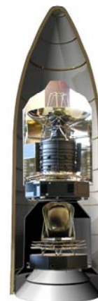
Herschel (oben) und Planck (unten) innerhalb der Nutzlastverkleidung der Ariane 5 (künstlerische Darstellung).

Zum ersten Mal werden zwei unabhängige wissenschaftliche Missionen der ESA gemeinsam mit einer Trägerrakete gestartet. Dies macht Sinn, da die beiden Satelliten in ähnlichen Umlaufbahnen platziert werden sollen. Dadurch kann natürlich auch eine signifikante Reduktion der Kosten für die einzelnen Projekte erreicht werden. Die ESA-Trägerrakete vom Typ Ariane 5 ECA wird üblicherweise zum Transport von kommerziellen Kommunikationssatelliten eingesetzt und kann Nutzlasten von bis zu 9.6 Tonnen in eine geostationäre Transferbahn einschicken. Der Start des Satelliten-Duos erfolgt am 14. Mai 2009 vom ESA-Weltraumgelände in Kourou, Französisch-Guayana.