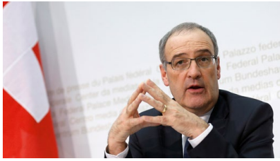
Guy Parmelin, Federal Councillor Head of the Federal Department of Economic Affairs, Education and Research (EAER)

Guy Bernard Parmelin was born in Bursins (Vaud) on 9 November 1959. He holds a federal baccalaureate specialising in Latin and English. Following a farming apprenticeship, he obtained a diploma from the agricultural college at Marcelin in 1979. In 1985, he obtained a Federal PET Diploma in agriculture and winemaking.