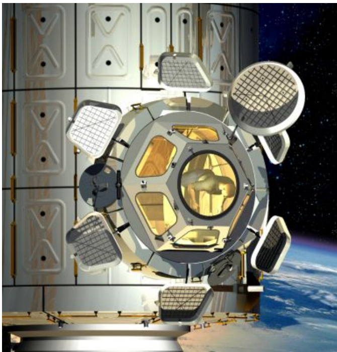
Graphische Darstellung der Cupola nach Installation an der Internationalen Raumstation.