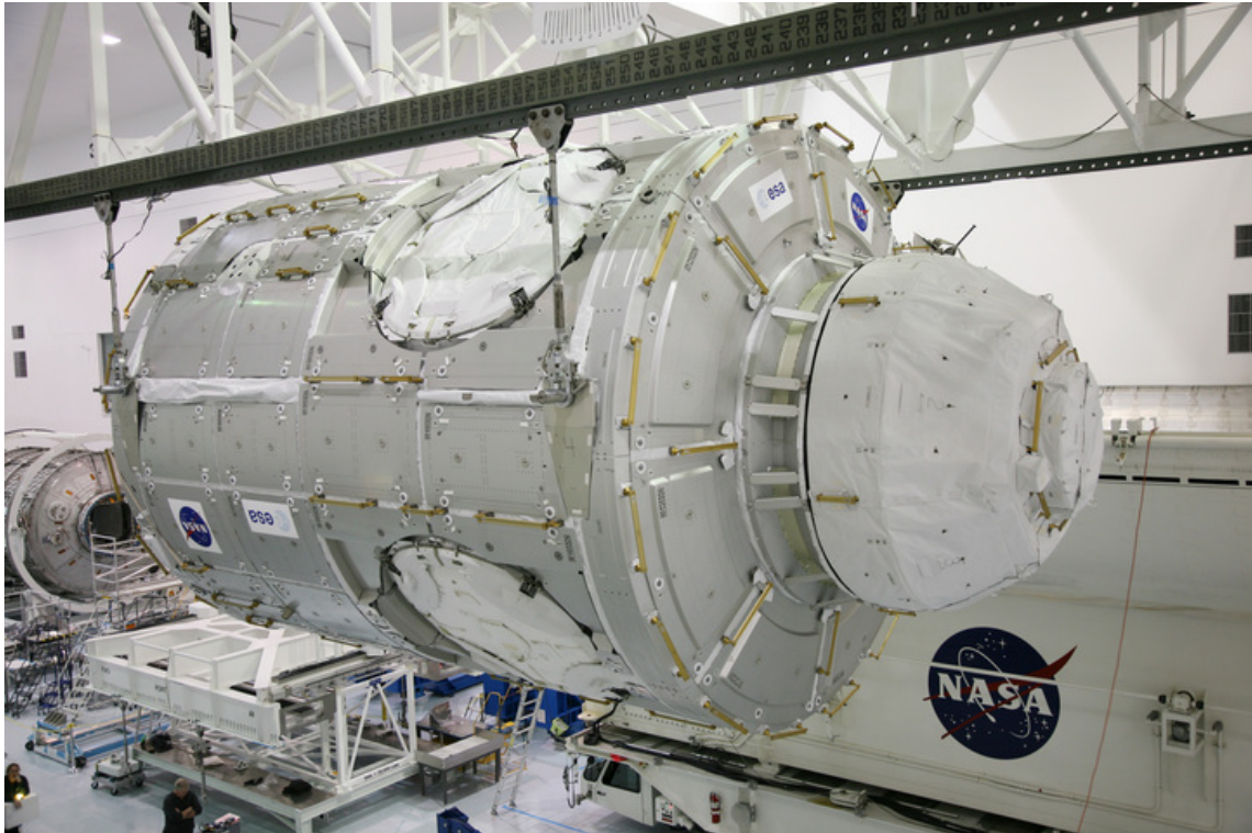
Das Verbindungselement 3 Tranquility wird am Kennedy Space Center für den Transport zum Startgelände bereitgemacht. Auf der rechten Bildseite ist die abgedeckte Cupola zu erkennen.