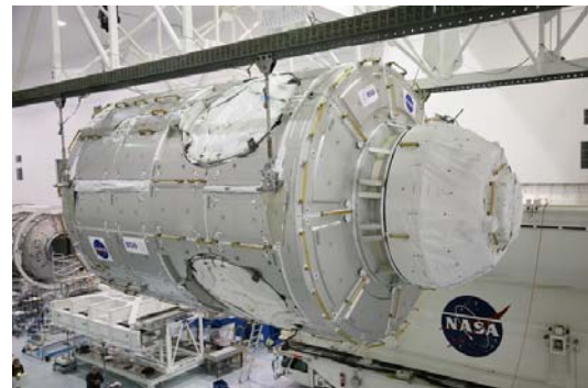
Das Verbindungselement 3 Tranquility wird am Kennedy Space Center für den Transport zum Startgelände bereitgemacht. Auf der rechten Bildseite ist die abgedeckte Cupola zu erkennen (Bild: NASA).

grund der Nutzlastkapazität des Space Shuttle sind beim Start nur fünf dieser Rack-Plätze besetzt; weitere Racks werden auf späteren Missionen installiert.