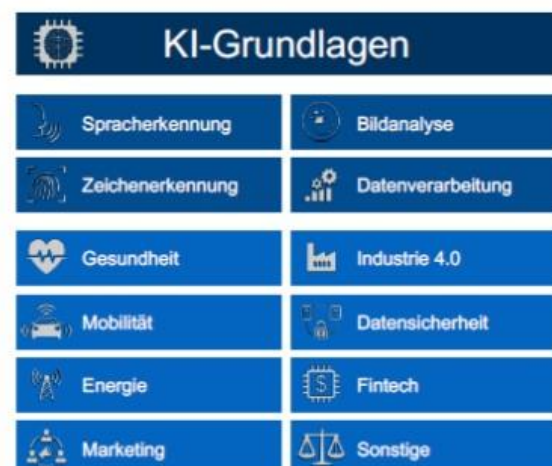
Abbildung 1. Technologiestruktur und Entwicklung der KI gemessen an Patenten.