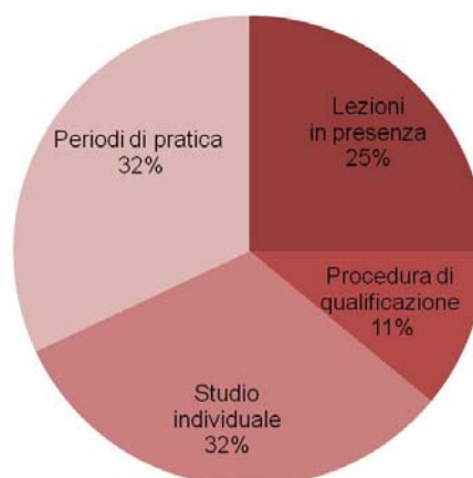
Esempio con percentuale maggiore di lezioni «in presenza».

Il rapporto tra lezioni «in presenza», studio individuale e procedure di qualificazione varia in funzione della prassi dell'istituto e della formazione progressiva dei partecipanti ai corsi. È fondamentale che gli studenti abbiano abbastanza tempo per esercitarsi ad applicare gli standard appresi.