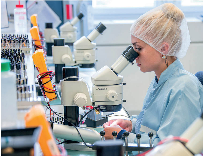
Das Verstehen von schriftlichen und mündlichen Arbeitsanweisungen ist entscheidend, um eine hohe Produktionsqualität gewährleisten zu können.

Digitalisierung, Automatisierung und neue Organisationsprozesse führen zu steigenden Anforderungen an Mitarbeitende in der Produktion. Um diesen Herausforderungen gewachsen zu sein, fördert die maxon motor AG in Sachseln (OW) im Rahmen des Bundesprogramms «Förderschwerpunkt Grundkompetenzen am Arbeitsplatz» ihre Mitarbeiterinnen und Mitarbeiter mit arbeitsplatzorientierten Sprachkursen. Das Verstehen von schriftlichen und mündlichen Arbeitsanweisungen ist entscheidend, um die hohe Produktionsqualität gewährleisten zu können.