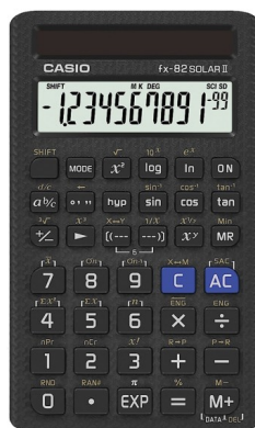
b) Casio FX-82 Solar II