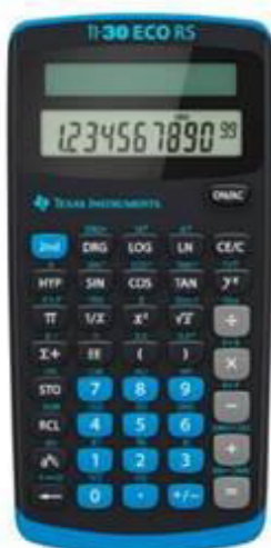
Texas Instruments TI-30 eco RS