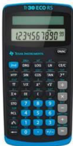
Texas Instruments TI-30 eco RS