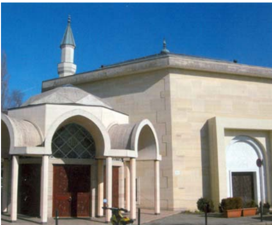
Mosquée de la Fondation culturelle islamique de Genève