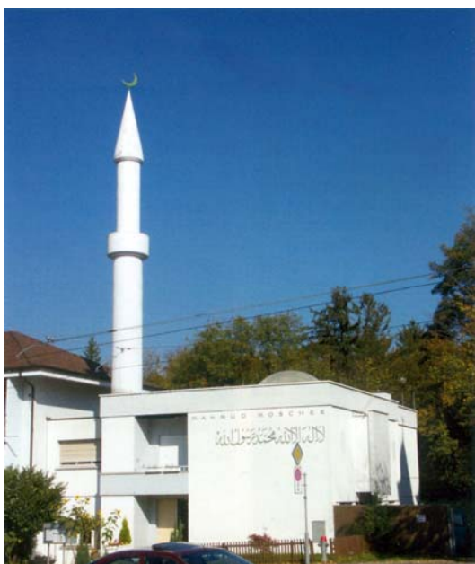
Expressions architecturales de la diversité religieuse et culturelle de l'Europe.

D'une part, la diversité thématique dans laquelle s'inscrit le débat sur le dialogue interculturel à des niveaux politiques très nombreux 55 et la multiplicité des objectifs que ses protagonistes lui fixent conduisent à s'interro-