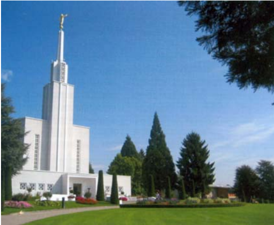
Temple de l'Église de Jésus-Christ des Saints des Derniers jours, Zollikofen