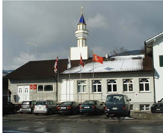
Mosquée de l'Association culturelle turque, Wangen près d'Olten