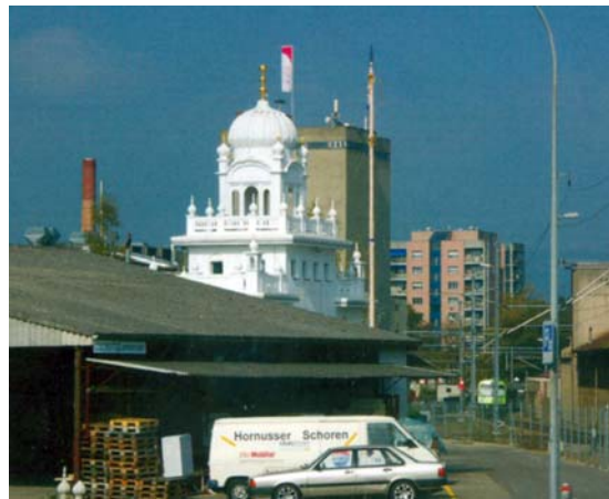
Gurdwara de la Fondation Sikh, Langenthal

Autrefois marquée par le christianisme, la société suisse se caractérise désormais par la diversité religieuse. Un rôle éminent revient au dialogue pour une meilleure compréhension mutuelle entre les communautés religieuses et leur cohabitation.